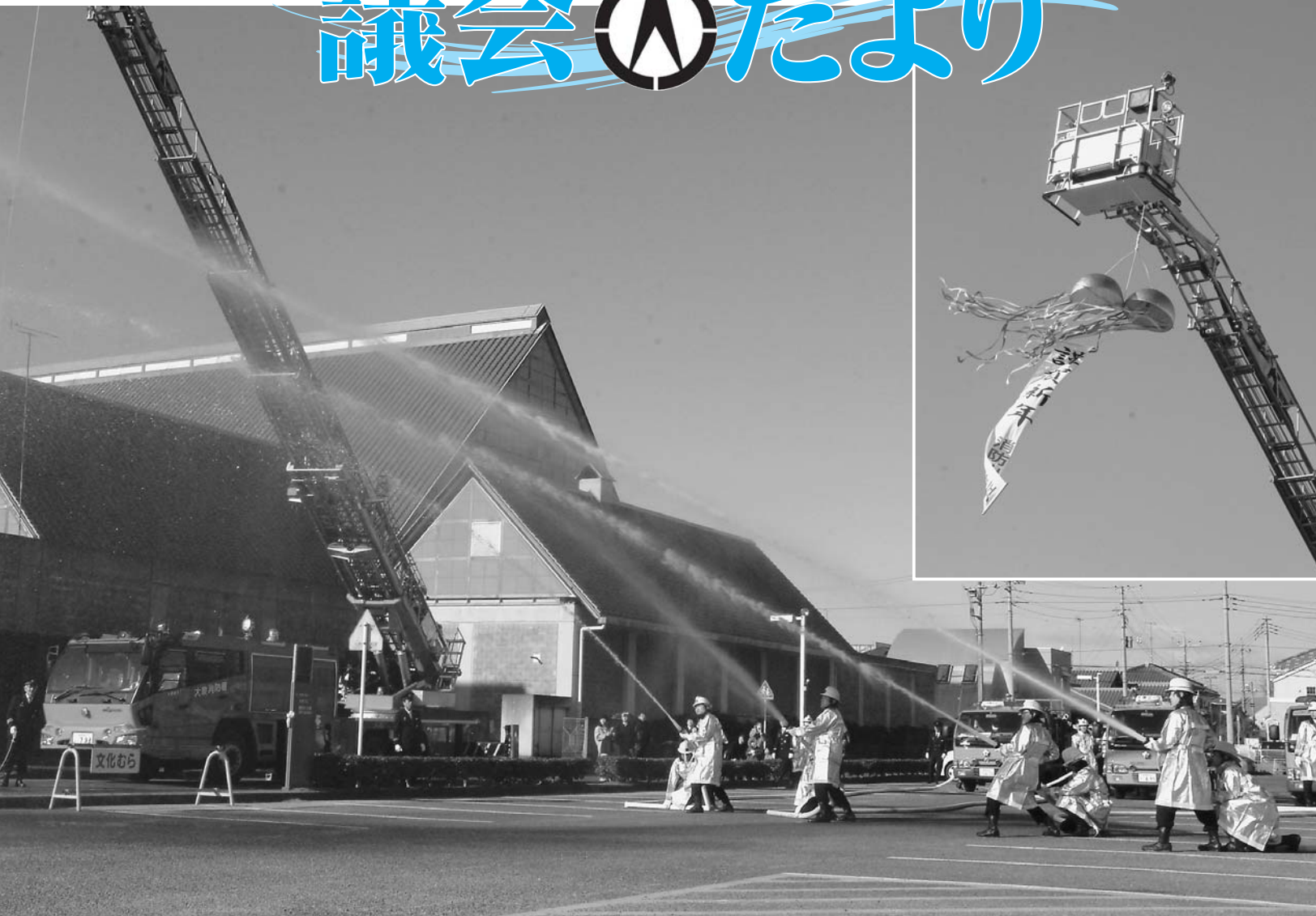
大泉町消防出初式（平成24年1月7日）