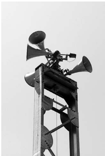
緊急時に備えた有効な防災無線設置を