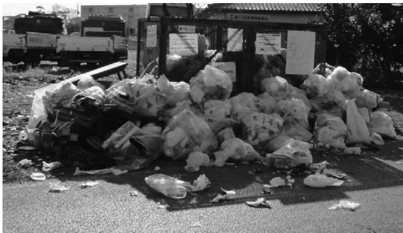
無秩序なごみステーション

直接指導やチラシなどの配布、看板の掲示を行っていません。それでも改善されない場合は、地域との調整がつけば、当該ステーションの廃止を行い、別の場所に新たに設置しています。