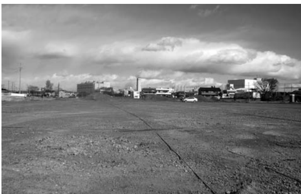
遊休地の有効活用を

工業振興について、 ①業種により雇用の拡大を考えている企業もあり、各関係機関と連携して雇用対策を検討していきます ②拡張を考えている企業もあり、近隣自治体とも連携を図りながら検討します ③ものづくりのまち宣言ができるように努力していきます ④発想とやる気が、活気と賑わいのあるまちづくりの第一歩です。経済的には、雇用の安定が第一であり、それが安心感になり観光や消費へとつながり、ひいては商業の活性化にもつながっていくと思えます