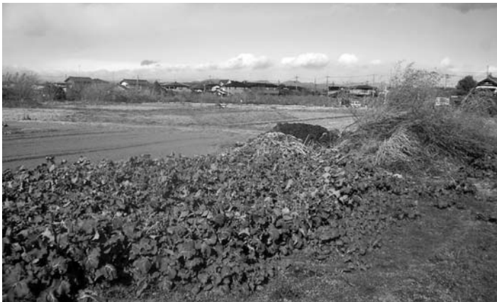
夢のある農地利用を

大泉ブランドの製品を考える上で町内にある高校の技術を生かした協働の農業施策について、今後調査研究していきたい。「道の駅」建設については、今後の社会情勢や経済状況などを見極めながら検討していきたいと思えます。