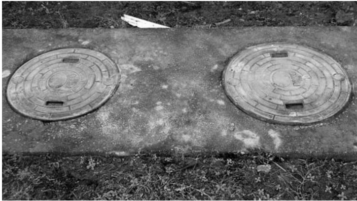
しっかりとした浄化槽管理を

願っています。また、別業者紹介の相談があった場合には、清掃組合代表者に相談するようお願いしています。