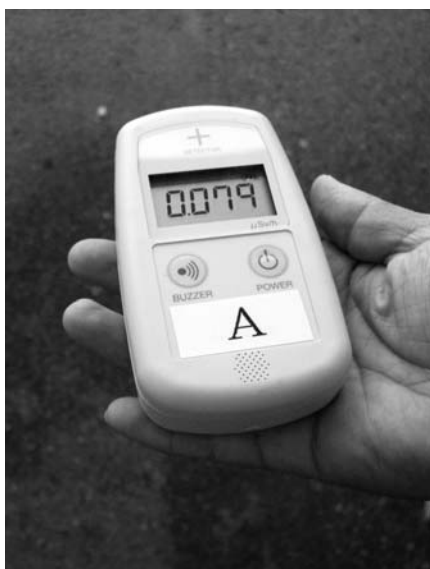
子どものためにしっかりとした測定を

学校給食も放射性物質の測定を開始しました。今後、町独自の検査を考慮に入れながら、県が安全宣言を出している安全安心な食材を使用し提供していきます。