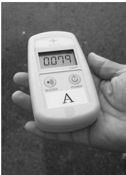
安心して住める町に（放射線量の測定）

(2) 税の収納率向上と土地などの町有財産の売却を行い財源確保に努めます。また、「住宅リフォーム助成制度」の調査検討をはじめ、住みたい町づくりに全力をあげます