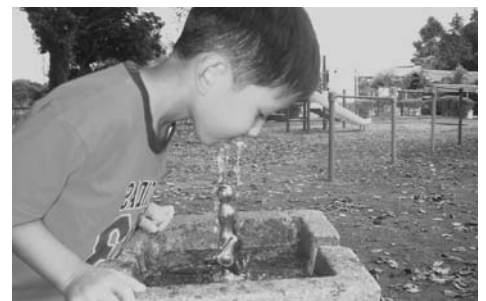
誰でも安心して飲める水道水