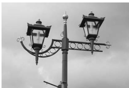
LED化で節電を（西小泉商店街）

A 自主防災組織の活用については、今後初動マニュアルを策定し、即応体制を整えたい。町民への情報伝達は、町広報車や公民館、電子メールを通じて行いましたが、今後は防災無線も調査していきたい。