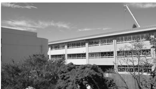
着々と進む教育環境整備（南中新校舎）