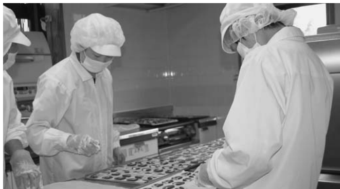
いろいろな授産支援を（地域活動支援センター）

クル製品の製造販売を行う ことについては、廃油処理 用の独自の作業棟新設や、 劇薬を扱うため、しっかり した管理体制、また、製造 過程も含めた安全管理要員 の整備など、いくつかの課 題もありますので、今後調 査研究をしていきたいと思 います。