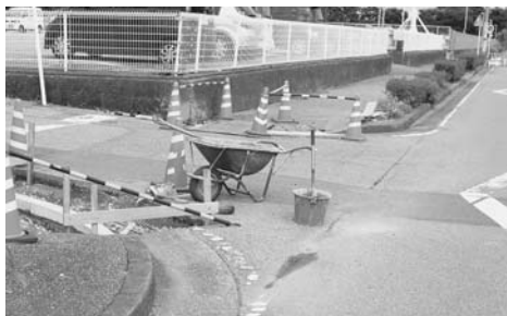
人にやさしいバリアフリーの町づくり

※皆さんの傍聴をお待ちしています。どなたでも気軽に傍聴できます。詳しくは、議会事務局へ。