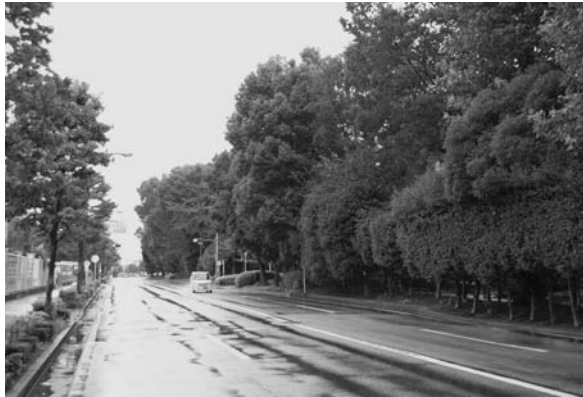
明るい公園づくりを（いずみ緑道）

また、街区公園については、場所によって雑草対策などの維持管理面で温度差が見られます。地域の身近な公園を、地域の人たちで考え、地域の人たちの手によって、地域の皆さんに愛される公園づくりのシステム構築を求めます。