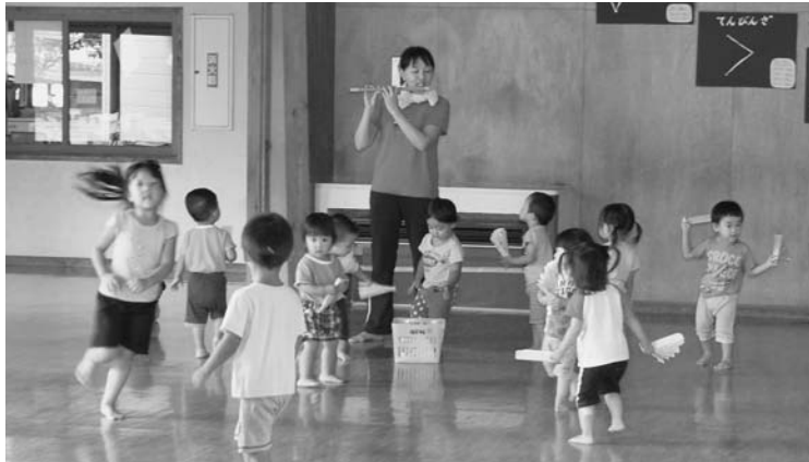
子育て環境の充実を（北保育園）

新システムが執 行されたあかつき に制度的矛盾が露 出することは多々 あります。行政と してそぐわない制 度であれば、反対 することにやぶさ かではありませ ん。できるだけ力 を注ぎたいと考 えています。