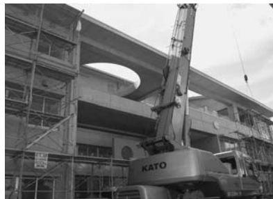
耐震対策万全の校舎（南中新校舎）

A 肺がん検診は単独の検診ではなく、結核検診にセットされています。今後、手続き方法の改善やPR方法などを検討します。